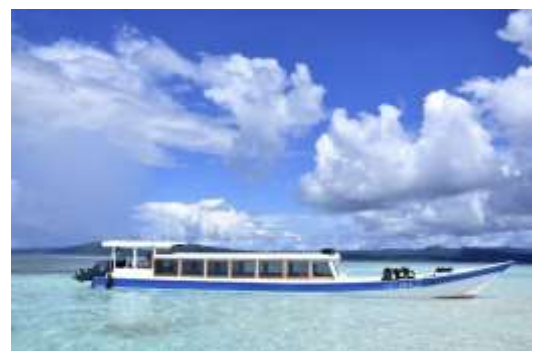
Un de nos bateaux de transfert - "Explorer I"

prendriez pas la navette régulière il vous sera nécessaire d'affréter un taxi bateau que nous sommes à même d'assurer. Le transfert de l'hôtel vers Sorong est fixé à 6h00 du matin les dimanches et les mercredis.