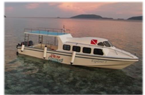
Eines unserer Resort Transfer Boote - "Explorer 5"

Das Papua Explorers Resort ermöglicht jeden Sonntag und Mittwoch fahrplanmäßig Transfers zur Insel. Unser Boot legt um 12 Uhr mittags ab. Daher empfehlen wir unseren Gästen, Ihre Flüge nach Sorong so zu organisieren, dass Sie ohne Verspätung unser Boot erreichen. Transferwünsche, die vom Fahrplan abweichen, werden den Gästen berechnet. Auch wenn wir bei Flugverspätungen Verständnis haben, können wir leider aus Rücksicht auf die bereits wartenden Gäste und um Unannehmlichkeiten während der Reise zu vermeiden, das Boot nicht warten lassen. In diesem Fall benötigen die Gäste mit Verspätung eine Sonderfahrt. Aus diesem Grund ist eine Reiseversicherung empfehlenswert.